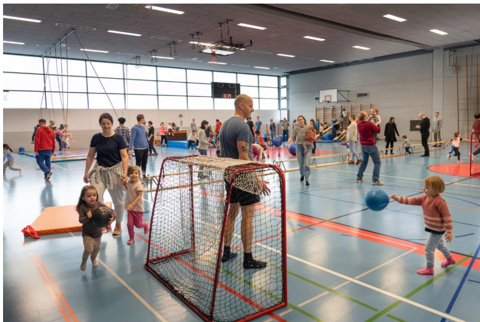
Buntes Treiben am Sonntagmorgen in der Wartegg-Turnhalle. An Spitzentagen trafen sich jeweils über 150 Besucherinnen und Besucher in der «Offenen Sporthalle».

von Valery Furrer, Redaktion Tripsche Zytig